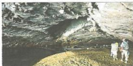
Des barques pour une visite de la grotte.