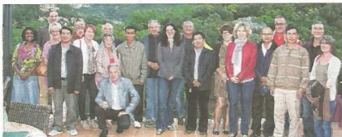
Un souvenir pour marquer la présence de la délégation et de celles des intervenants sur le projet.

Vendredi 26 septembre aux Blachas de Salavas, une rencontre avec les élus a marqué la poursuite de l'opération d'appui à la structuration de l'écotourisme de la Province de Khammouane au Laos déjà initiée en 2012 avec la région Rhône-Alpes avec le concours de Tétraktys (Association de Coopération pour le Développement Local des Espaces Naturels) et du SGGA (Syndicat de Gestion des Gorges de l'Ardèche).